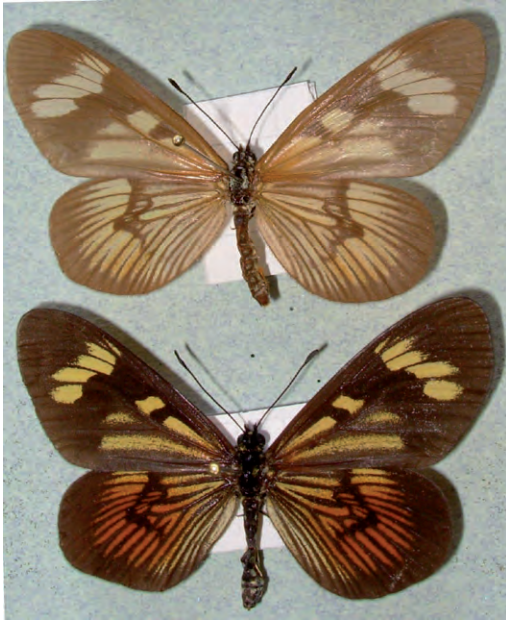
Figura 6 - Pareja de Actinote pellene de muy distintos fenotipos colectada en cópula.

en la zona y muchos ejemplares salidos de las mismas se corresponden con A. carycina , lo cual estaría de acuerdo con lo que expresaba Brown Jr. (1992) que A. carycina es solo una forma de frío de A. pellene . En RN se ha colectado una pareja en cópula en la que el ♂ parece un A. carycina y la ♀ se corresponde con la forma pálida de A. pellene calymna (Figura 6). Para el autor, A. p. calymna sería solo un sinónimo de A. p. pellene (Nuñez Bustos, 2008; 2010). Es preciso realizar mayores estudios biológicos, taxonómicos y moleculares pero al menos en la zona rioplatense el supuesto A. carycina sería solo una forma climática (un fenotipo) de A. pellene y no dos especies que se hibridizan como se creía (Nuñez Bustos, 2008; 2010). En el sur de Brasil se comprobó ambas especies difieren poco o nada a través de estudios moleculares (Silva-Brandão et al. , 2008). En VL se han colectado grandes series de A. pellene y muestran una variabi-