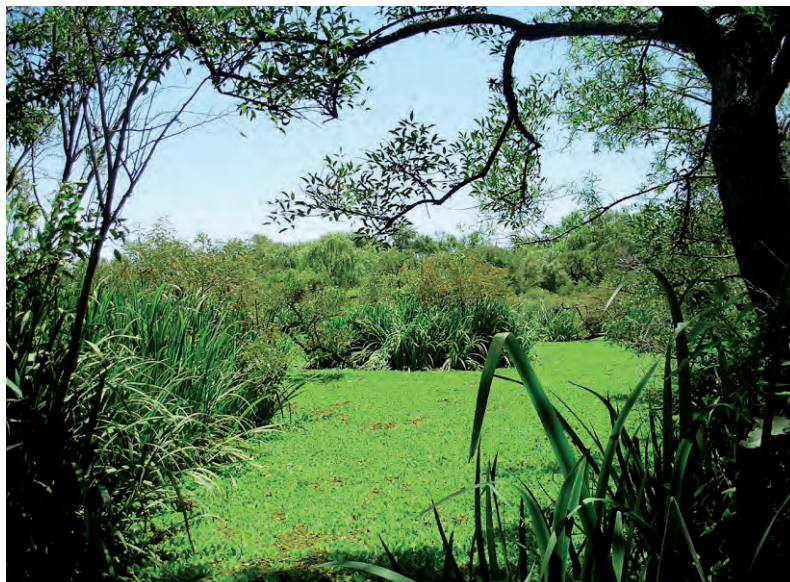
Figura 1 - Reserva Municipal Ribera Norte.

La Reserva Municipal Ribera Norte (RN) se halla ubicada en la costa del río de la Plata, en el barrio de Acassuso (partido de San Isidro) y es el único lugar del área norte ur-