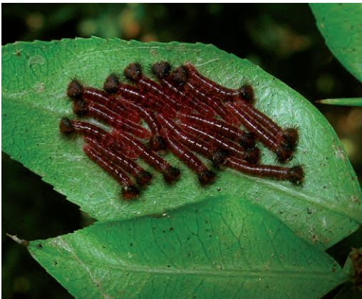
Figura 5 - Larvas jóvenes de Morpho epistrophus argentinus en abril.

e incluso una hembra poniendo huevos en plantas de Ingá ( Inga uraguensis ) en RN.