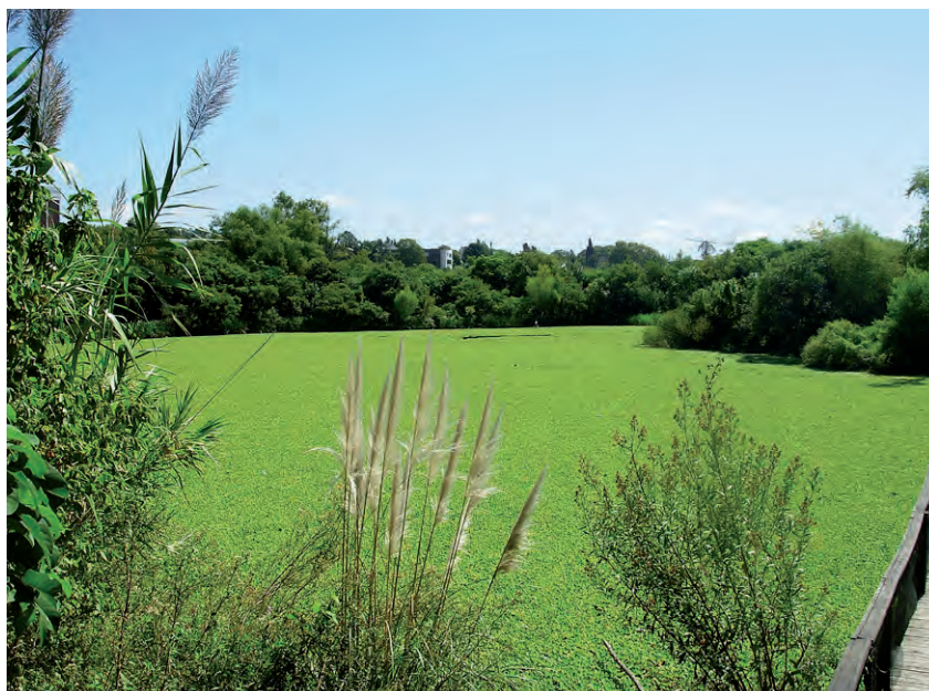
Figura 2 - Reserva Municipal de Vicente López.