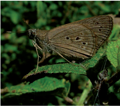
Figura 4 - Argon lota (Hesperiidae).

Otra especie notable hallada recientemente en ambas reservas es Phoebis argante (Pieridae), la cual solo tenía citas para Isla Martín García (Núñez Bustos, 2007; 2010) y Costanera Sur (Núñez Bustos, 2008; 2010). Fueron vistos muchos ejemplares machos