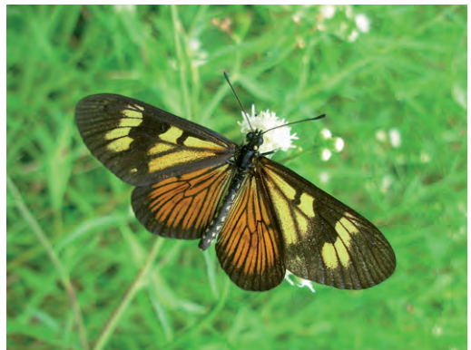
Figuras 7 a 12 - Variedades de Actinote pellenea .