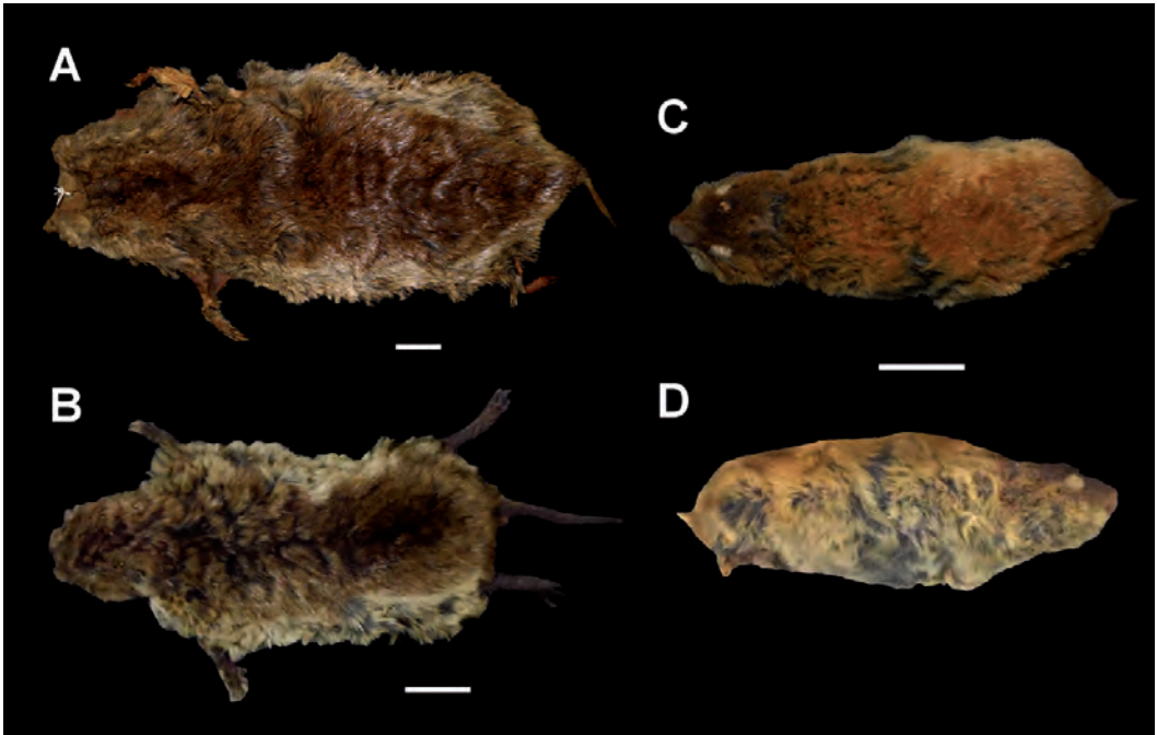
Figura 2 - Ejemplares de Ctenomys talarum registrados en el presente trabajo. (A) MACN-Ma 33.204, piel conservada en vista dorsal; (B) MACN-Ma 33.205, piel conservada en vista dorsal; (C-D) MACN-Ma 5.9, piel conservada de ejemplar juvenil en vistas (C) dorsal; (D) lateral derecha. Escala: 1 centímetro.

incisivos, de tamaño pequeño (Ancho del incisivo superior: 2.5 mm) y débilmente proodontes ( sensu Quintana, 2004).