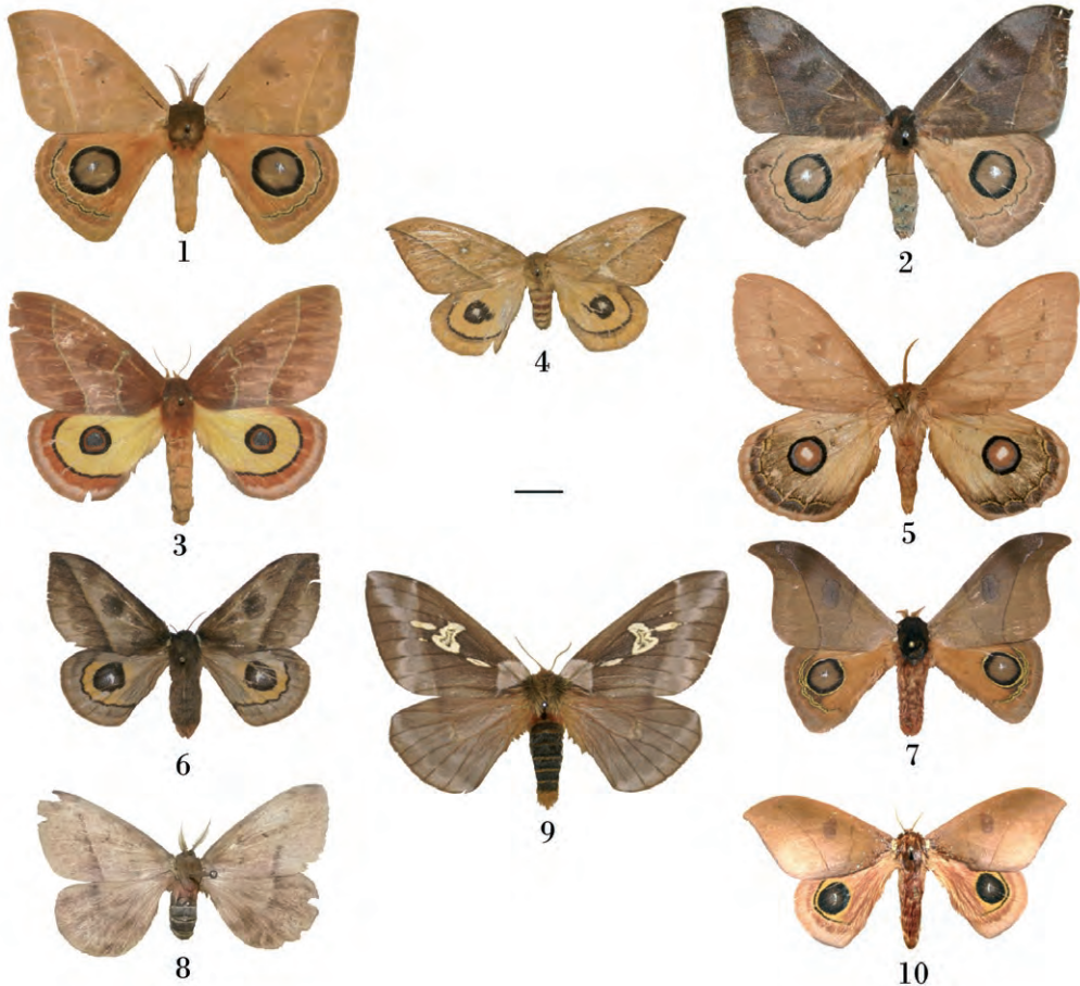
Figura 2 - Automeris bilinea : 1 macho. Automeris chacona ssp cochabambae : 2 hembra. Automeris granulosa : 3 hembra. Automeris grammodes : 4 hembra. Automeris submacula : 5 macho. Automeris margaritae : 6 hembra. Automeris hamata : 7 macho. Cerodirphia zikani : 8 macho. Dirphiopsis cochabambensis : 9 hembra. Automeris nebulosa : 10 macho. La escala representa 1 cm.

Jujuy: Dto. Ledesma, Calilegua, 1 macho 02/08-Dic-2009, L. Coronel Leg. [AB]; Salta: Dto. Santa Victoria, Los Toldos 2300 msnm, 1 macho 14-Dic-2005, J. Carreras Leg. [AB]; 2 macho 20-Dic-2005; 1 macho 22-Dic-2005; 2 hembras 23-Dic-2005; 1 macho Oct-2006; 1 macho 21-Dic-2006, J. Carreras Leg. [FP]; Los Toldos, El Lipeo 2500 msnm, 1 macho 22-Dic-2005, J. Carreras Leg. [AB]; Dto. San Ramón de la Nueva Orán, Aguas Blancas, 1 macho 26-Feb-2008, J. Carreras Leg. [AB]