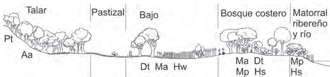
Figura 3 - Patrón de distribución horizontal de los opiliones de la localidad de Lima en una transecta desde las barrancas hacia el río (SSW-NNE aproximadamente). No a escala. Pt: Pachyloides thorellii ; Aa: Acanthopachylus aculeatus ; Dt: Discocyrtus testudineus ; Ma: Metalibitia argentina ; Hw: Holmbergiana weyenberghii ; Mp: Metalibitia paraguayensis ; Hs: Hernandaria scabricula .