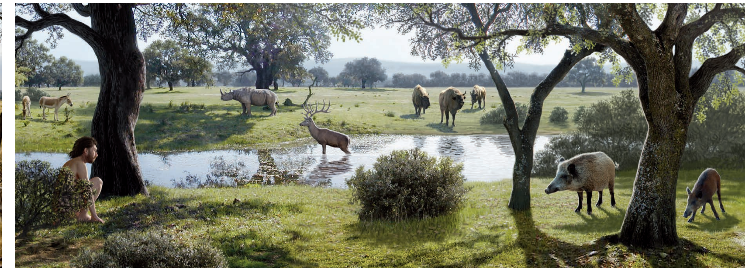
Homo antecessor (Atapuerca, España, 800.000 años).