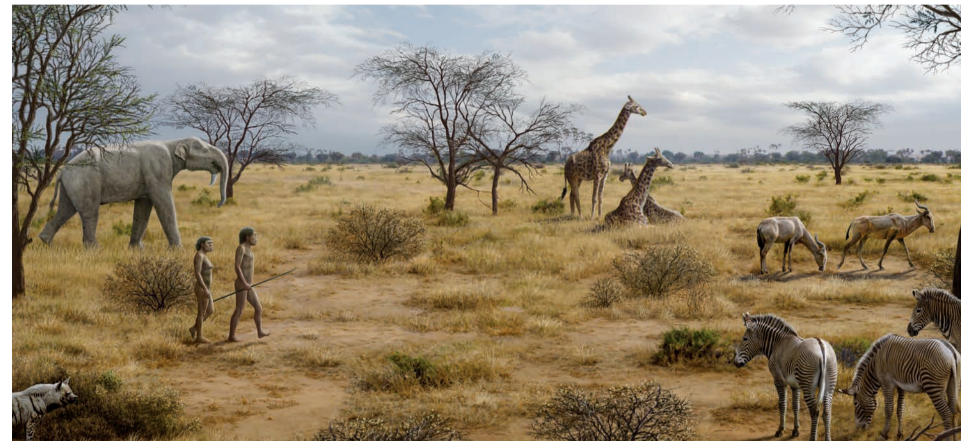
Homo habilis (Kenia, África, 1.700.000 años).