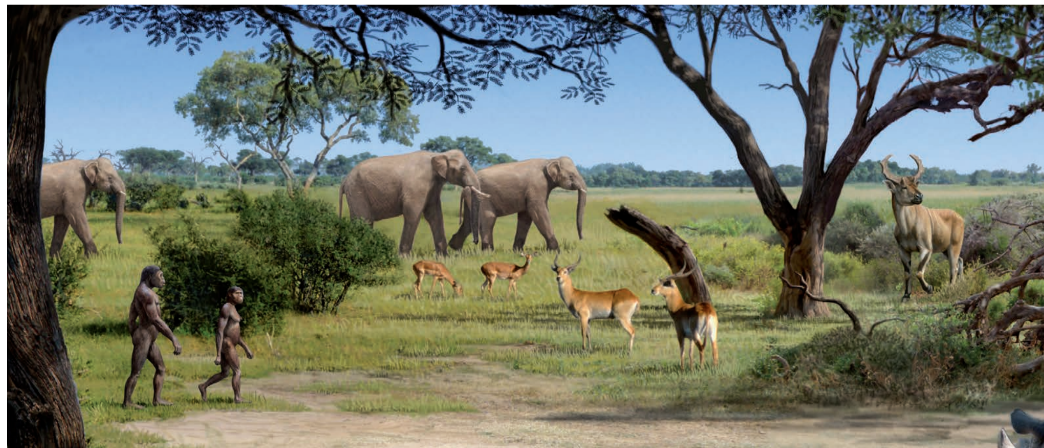
Australopithecus afarensis (Hadar, Etiopía, África, 3.200.000 años).

Todas las personas somos primates que pertenecemos a la especie Homo sapiens , el único homínido que subsiste en la Tierra.