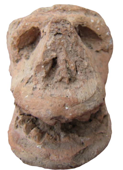
Rostros modelados en cerámica hallados en Catamarca.