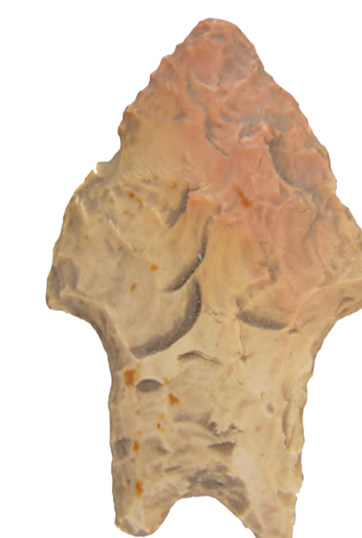
Puntas de proyectil de piedra de la Patagonia y el Noroeste Argentino.