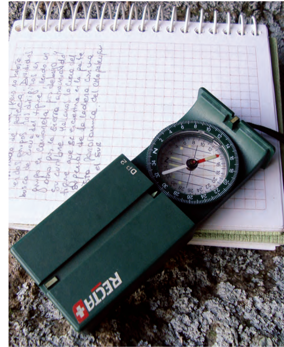
Implementos para el trabajo de campo.