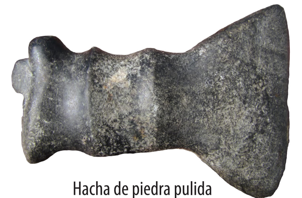
Hacha de piedra pulida del Noroeste Argentino.