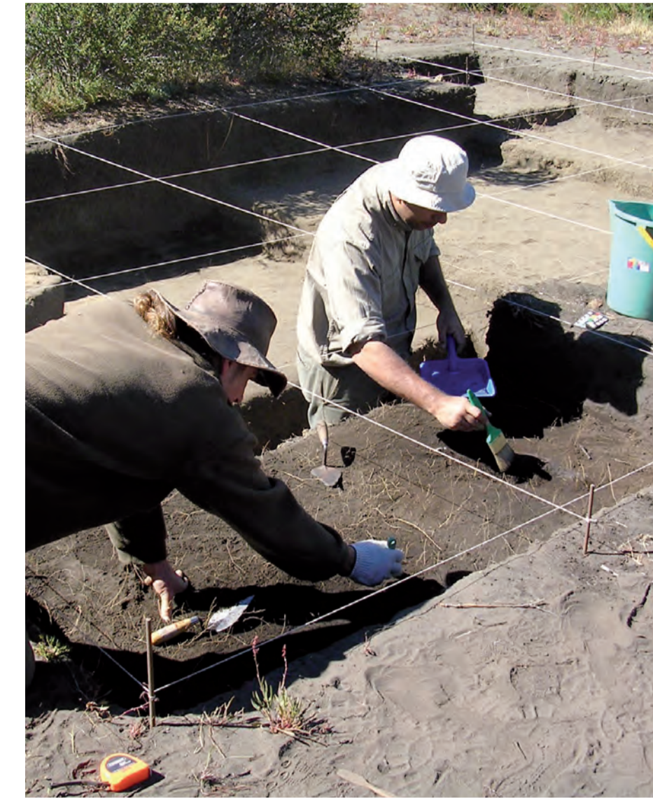
Excavación en la Patagonia Argentina.