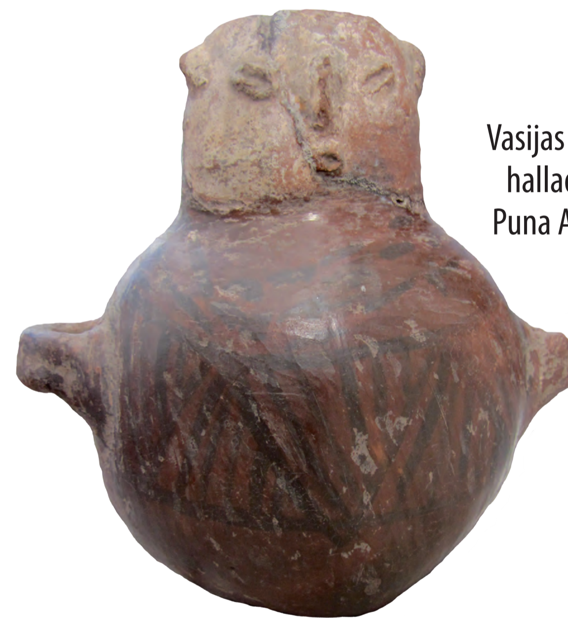
Vasijas cerámicas halladas en la Puna Argentina.

En la foto se observa la excavación de un sitio arqueológico en un alero rocoso en el Norte Argentino.