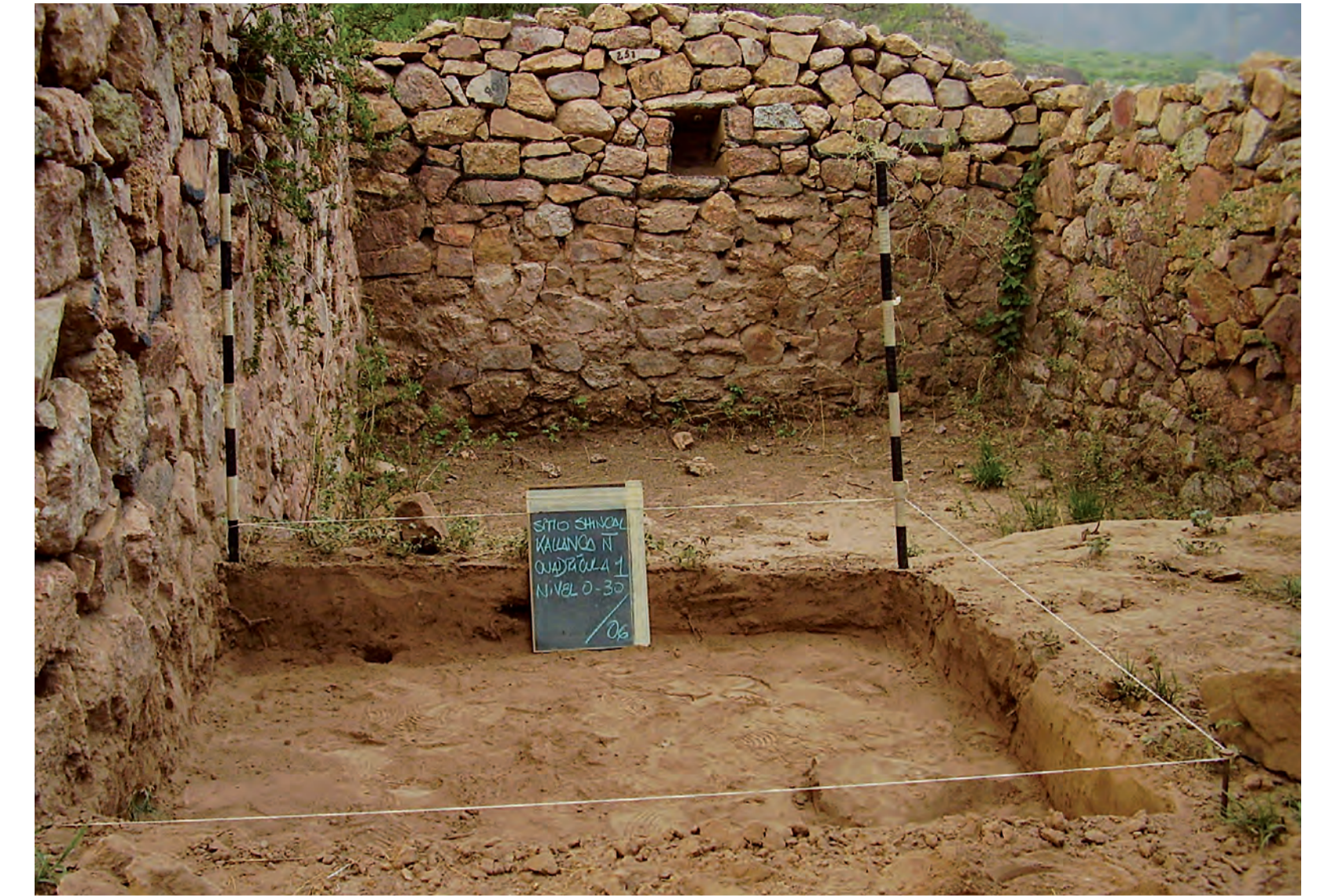
Excavación en el sitio incaico llamado El Shincal, Catamarca.