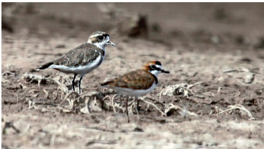
Foto 6. Individuo de Charadrius alticola (izquierda superior de la imagen) junto a un Charadrius collaris (derecha inferior). Se aprecia mayor volumen corporal del Charadrius alticola . Un rasgo característico del género es el ojo respecto al tamaño de la cabeza. Si bien ambos son de hábitos gregarios, no suelen formar bandadas numerosas. Fotografiados el 10 de abril de 2010 en la Laguna Seca, Mendoza.

El 21 de noviembre de 2010 en la Laguna de Guanacache, departamento Sarmiento (32° 07' 18" S 68° 25' 36" O, 541 m s.n.m.), provincia de San Juan, fueron