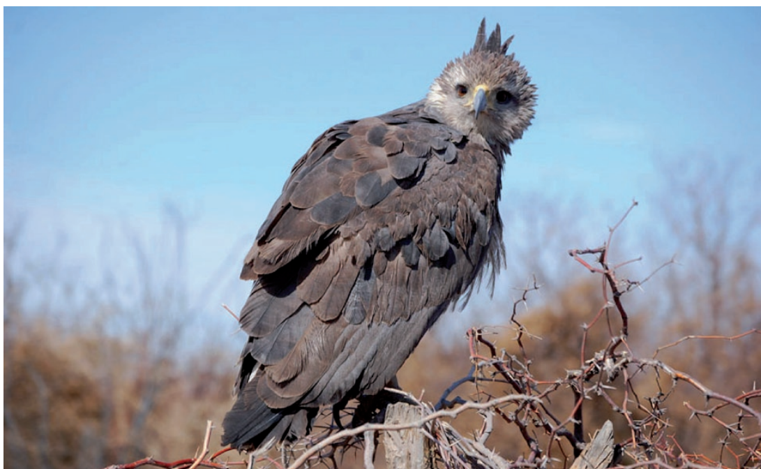
Foto 5. El subadulto de la imagen ostenta el notable copete nucal que da fundamento a su nombre vulgar. La cabeza denota tonos ocráceos, algo estriados, pero más claros en las mejillas. Es destacable en el manto superior del ejemplar, la irrupción del nuevo plumaje que contrasta con la notoria erosión de las plumas del resto del manto, remeras y timoneras. La brevedad de la cola insinúa, incipiente reborde terminal claro en el área apical. Fotografiado el 12 de septiembre de 2010 en el puesto El Tamarindo, departamento Sarmiento, San Juan.

El 1 de mayo de 2009 aperchados en un bosquecillo de chañar ( Geoffroea decorticans ) junto a una pequeña represa en el secano lavallino (32° 26'46''S 67° 24' 58'' O, 494 m s.n.m.) ubicado en el departamento Lavalle, provincia de Mendoza, fueron observados tres ejemplares, dos adultos y un juvenil, probablemente la pareja