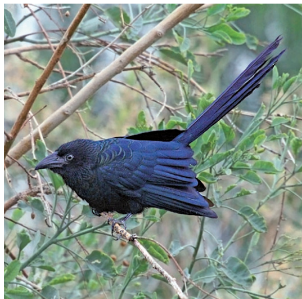
Foto 8. Por la coloración del ejemplar de Crotophaga major , podría tratarse de un subadulto fotografiado el día 12 de marzo de 2011 en la localidad de Cienaguita, departamento Sarmiento, provincia de San Juan.

El 12 de marzo de 2011 en la localidad de Cienaguita, departamento Sarmiento, provincia de San Juan (32° 04' 22'' S 68° 41' 43'' O, 729 m s.n.m.) se registró un ejemplar juvenil al que se le observó su característica cola larga, violácea con el iris pardo y escaso desarrollo de la protuberancia sobre la maxila que son caracteres distintivos de su etapa de vida, en un frondoso bosque de Geoffroea decorticans que permaneció durante tres días en el área (Foto 8). Narosky e Yzurieta (2010) dan su distribución en la Argentina desde el norte hasta las provincias de Tucumán, Santiago del Estero, norte de Santa Fe, Corrientes y como probable o accidental en el este de Catamarca, La Rioja, San Luis, Córdoba, sur de Santa Fe, Entre Ríos y norte de Buenos Aires.