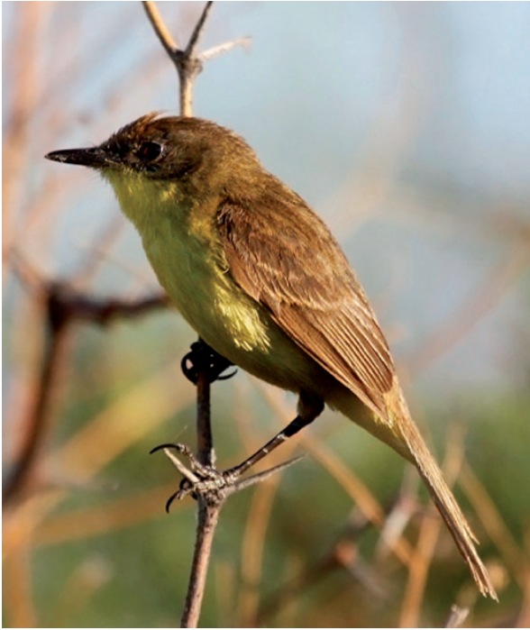
Foto 11. Individuo de Pseudocolopteryx sp. detectado el 26 de diciembre de 2010 en la Laguna del Toro, Sarmiento, posado en arbustos leñosos que proliferan cerca de la orilla en la provincia de San Juan.