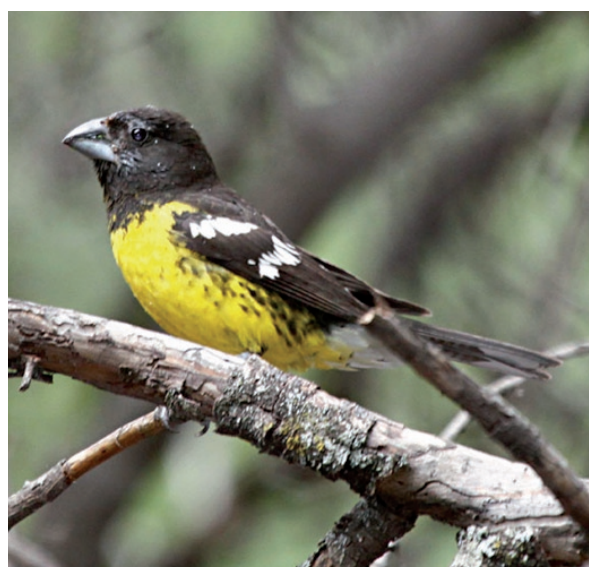
Foto 16. En este segundo individuo de Pheucticus aureoventris se trata de un macho aún en proceso de adquirir la característica coloración negra en el plumaje de la cabeza, fotografiado el 2 de enero de 2011 en la provincia de San Juan.

El presente trabajo revela la importancia de ciertas áreas cuyanas poco estudiadas respecto al cambio en la distribución de varias especies. Tal es el caso de la Laguna del Toro, departamento Sarmiento, provincia de San Juan. Esto demuestra la importancia de ambientes únicos y en peligro, tales como las Lagunas de Guanacache,