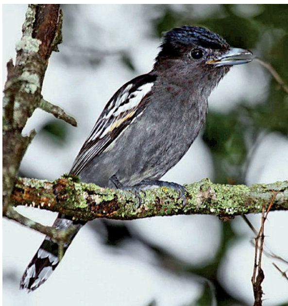
Foto 14. Ejemplar macho adulto de Pachyramphus polychropterus hallado el 7 de marzo de 2011 en la localidad de El Cantadero, departamento Capital, provincia de La Rioja.