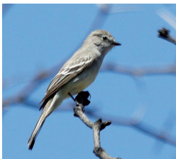
Foto 10. El ejemplar adulto de Sublegatus modestus corresponde a una especie asociada al monte arbustivo. Ejemplar observado el 21 de noviembre de 2010 en la localidad de Retamito, Sarmiento, provincia de San Juan.