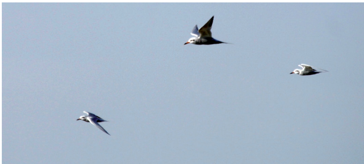
Foto 7. Individuos de Sterna trudeaui sobrevuelan el humedal en busca de peces o invertebrados que suelen capturar zambulléndose, al quedar expuestos en la superficie acuática observados el 21 de noviembre de 2010 en la Laguna de Guanacache, departamento Sarmiento, provincia de San Juan.

observados tres ejemplares desplazándose en vuelo planeado en busca de peces o invertebrados expuestos en la superficie acuática (Foto 7). Dicho sitio integra el sistema de Lagunas de Guanacache, Desaguadero y Del Bebedero, que en su totalidad fue incorporado como Humedal de Importancia Internacional en el listado de sitios RAMSAR y que es compartido por tres provincias (San Juan, Mendoza y San Luis).