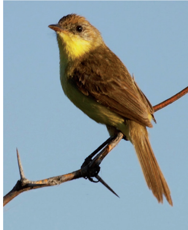
Foto 12. Otro individuo de Pseudocolopteryx sp. detectado el 26 de diciembre de 2010 en la Laguna del Toro, Sarmiento, provincia de San Juan.