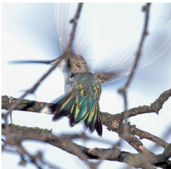
Foto 9. Hembra de Heliomaster furcifer observada el 8 de marzo de 2011 en la localidad de Usno, departamento Valle Fértil, provincia de San Juan.

Cabe destacar que por la ausencia de grabaciones sobre las vocalizaciones del taxón hallado para su comparación con las de Pseudocolopteryx citreola mediante un espectrograma, se prefirió denominarlo Pseudocolopteryx sp. hasta su total esclarecimiento para la provincia de San Juan.