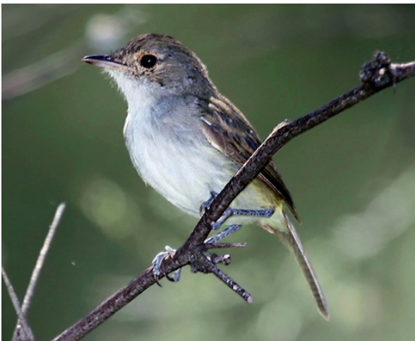
Foto 13. Ejemplar de Euscarthmus meloryphus registrado el 8 de marzo de 2011 en la localidad de Usno, departamento Valle Fértil, provincia de San Juan.

El 8 de marzo de 2011 en la localidad de Usno, departamento Valle Fértil, provincia de San Juan, en el mismo sitio del hallazgo de Helimaster furcifer , en un bosque relictual de Celtis sp., se registró una pareja de esta especie, la cual vocalizaba oculta en denso matorral (Foto 13). E. meloryphus se distribuye por una amplia zona de la Argentina, en las provincias de Jujuy, Salta, Tucumán, Catamarca (Nores e Yzurieta, 1981), Santiago del Estero (Nores e Yzurieta, 1982), Formosa,