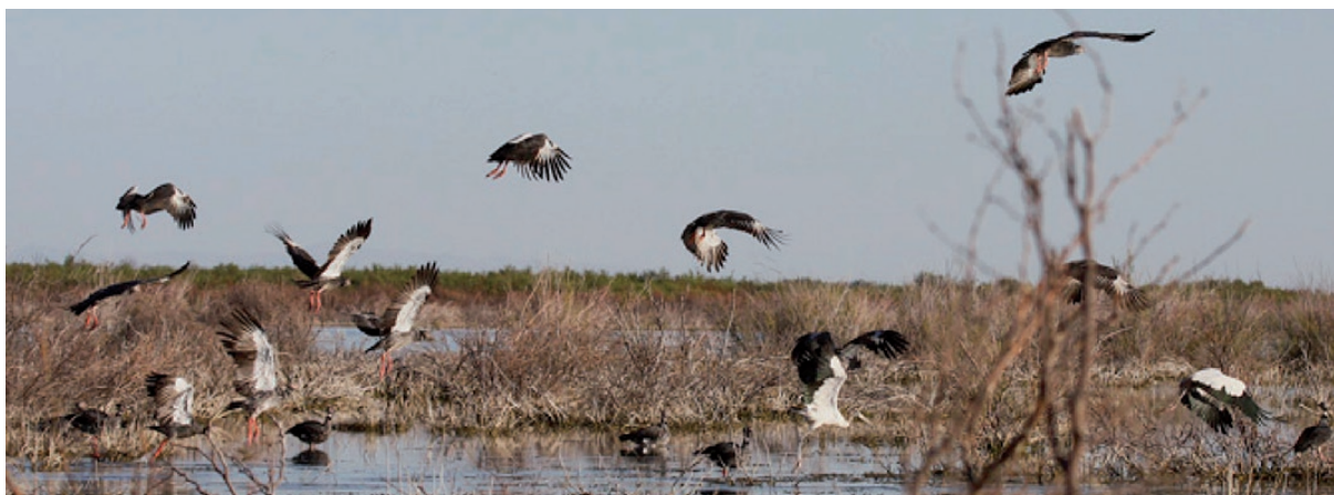
Foto 4. Ejemplares de Chauna torquata vadeando el bañado y otros compartiendo el vuelo con individuos de Tuyuyú ( Mycteria americana ) el 26 de diciembre de 2010 en la Laguna del Toro, Sarmiento, San Juan.

(32°05'32''S 68° 20' 08'' O, 540 m s.n.m) se observó una bandada que superaba los treinta a ejemplares, todos ellos reunidos en aguas someras (Foto 4). Dabbene (1910), siguiendo a Fontana (1908), la indica para el este de San Juan. Martínez et al. (2009) incluyen otros sitios observados de esta especie para la zona cuyana.