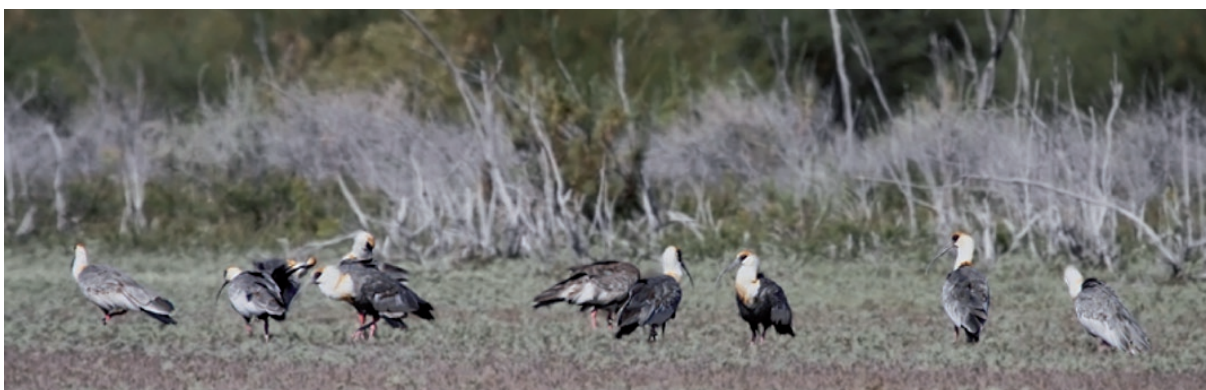
Foto 3. El hábito de conformar bandada se intensifica al culminar el ciclo reproductivo en Theristicus caudatus . Fotografía del 27 de marzo de 2011 en la Laguna Seca, Lavalle, Mendoza.