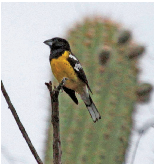
Foto 15. Individuo de Pheucticus aureoventris fotografiado el 2 de enero de 2011 en la provincia de San Juan.

P. aureoventris es un emberízido que soporta fuerte presión de caza en todo el rango de su distribución, principalmente en la ecorregión del Chaco serrano, en las provincias de Córdoba, San Juan, La Rioja, San Luis y Santiago del Estero (Chebez, 2009). En las provincias de San Luis (Nellar, 2007) como Córdoba (Miatello, 2007) es considerado como una especie “Vulnerable”.