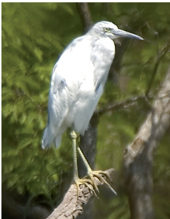
Foto 4. Típica postura de reposo de las Egretta spp., mientras expone su plumaje al sol (10 de septiembre de 2011).