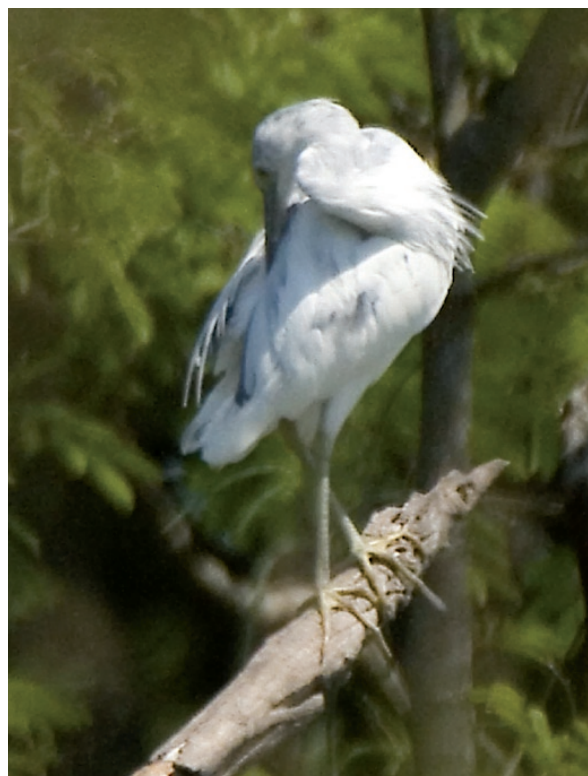
Foto 3. Al acicalarse quedan expuestas algunas plumas del ápice de las primarias alares de llamativos filetes oscuros y debajo del cuello las sobresalientes e incipientes egrettes (10 de septiembre de 2011).