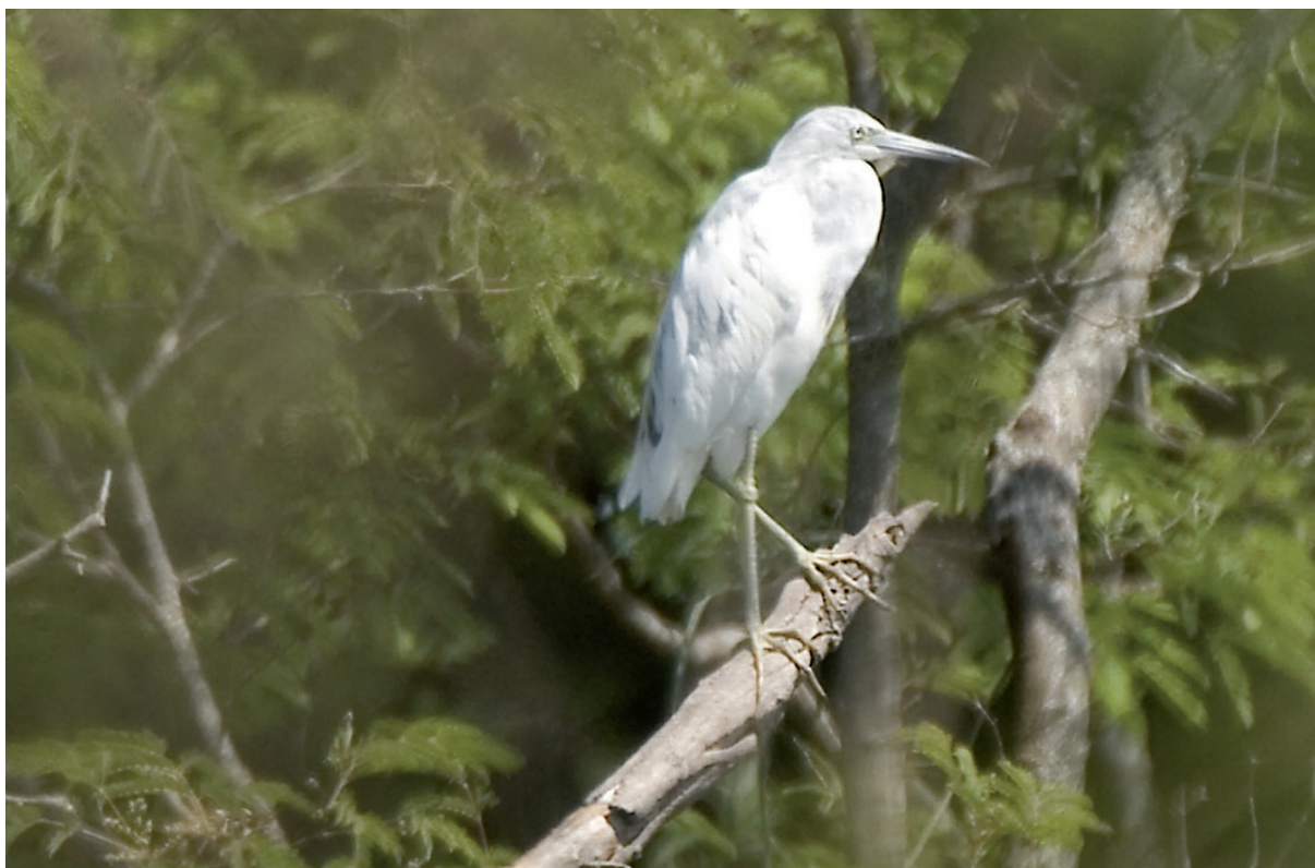
Foto 1. La postura delata en detalle los caracteres sobresalientes del plumaje del ejemplar juvenil ya descriptos (10 de septiembre de 2011).

A los pobladores del Paraje Fortín Arenales por los datos aportados sobre la fauna de la zona, especialmente a Don Palma y su hermana por recibirnos tan gentilmente, a Savina Ibañez por su amabilidad, al maestro Daniel Rizo Patral y alumnos de la Escuela EGB N° 798 por recibirnos y escucharnos.