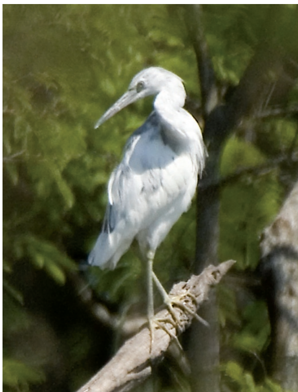
Foto 2. La secuencia de perfil destaca el diseño del pico, levemente curvado en el ápice. Luego desde su base hasta algo más de la mitad del tomia es claro para culminar en pardo oscuro (10 de septiembre de 2011).