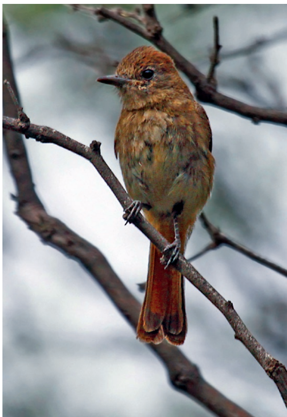
Foto 4. Juvenil de Knipolegus hudsoni en Retamito, Sarmiento, San Juan, fotografiado el 5 de febrero de 2011.