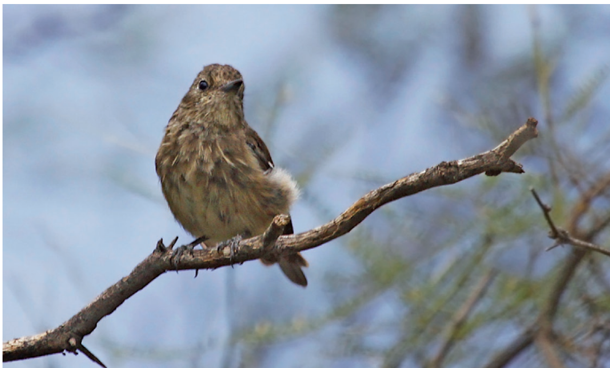
Foto 3. Hembra adulta en Retamito, Sarmiento, San Juan observada el 5 de febrero de 2011.