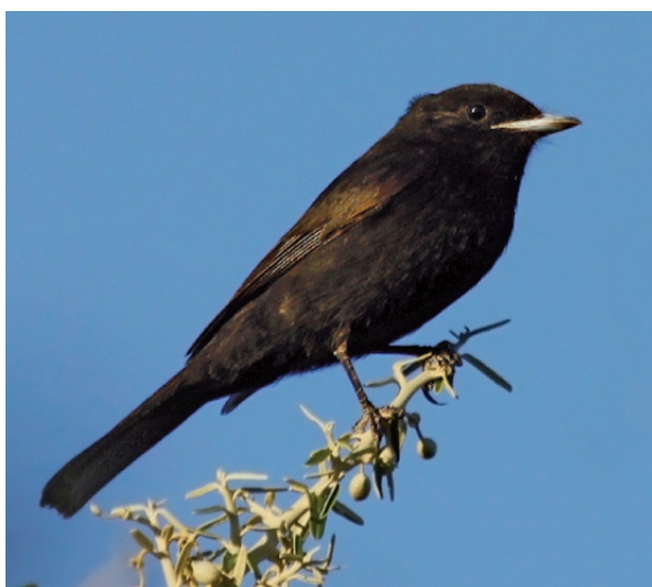
Foto 1. Ejemplar macho perchado en su atalaya de Capparis atamisquea , en la localidad de Retamito, departamento Sarmiento, provincia de San Juan, el 13 de enero de 2011.

Un resumen actualizado de su distribución puede ser consultado en Chebez (2009). Los dos registros revelados en la presente nota, completan la distribución y aportan manifestaciones de nuevos sitios de reproducción de este tiránido migratorio.