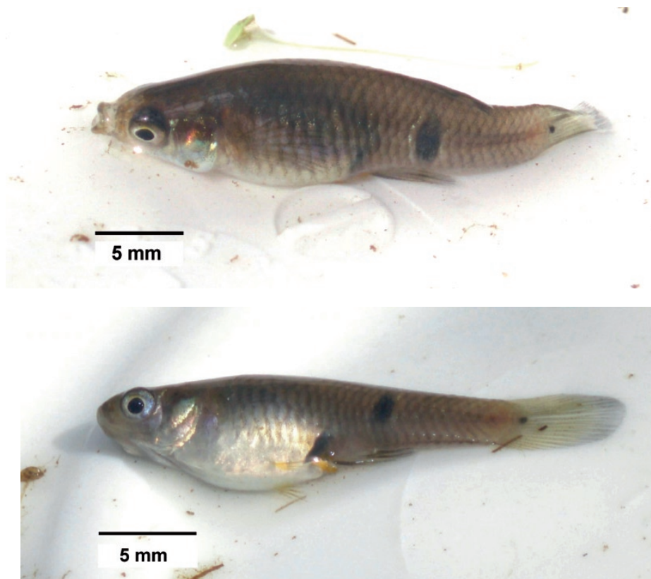
Foto 2 y 3. Ejemplar hembra de Phalloceros caudimaculatus (LT: 29 ± 1 mm) capturado en julio en el Refugio Natural Educativo Ribera Norte. Superior: vista lateral, Inferior: vista dorsal.

Phalloceros caudimaculatus fue citada para la provincia de Buenos Aires en el zona de La Plata por Almirón (1989 apud Liotta, 2006); en charcas cercanas a dicha área y en arroyos que desembocan en el Río de La Plata. Liotta et al. (2003). También citaron a la especie para