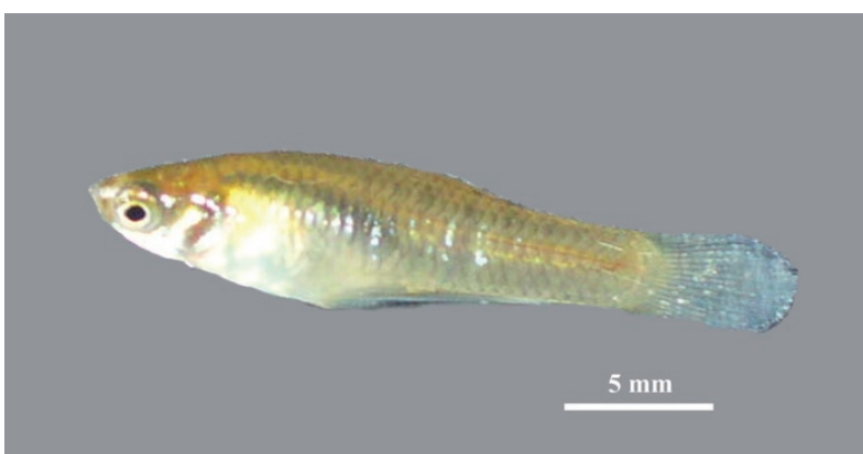
Foto 5. Vista lateral de un ejemplar macho de Phalloceros caudimaculatus (LT: 24 \pm 1 mm) colectado en noviembre en el Refugio Natural Educativo Ribera Norte.

la localidad de Otamendi (Buenos Aires), en canales de drenaje al Río Paraná de las Palmas (Liotta, 2006).