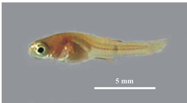
Foto 4. Cría hembra (LT: 12 \pm 1 mm) de Phalloceros caudimaculatus , obtenida en cautiverio.