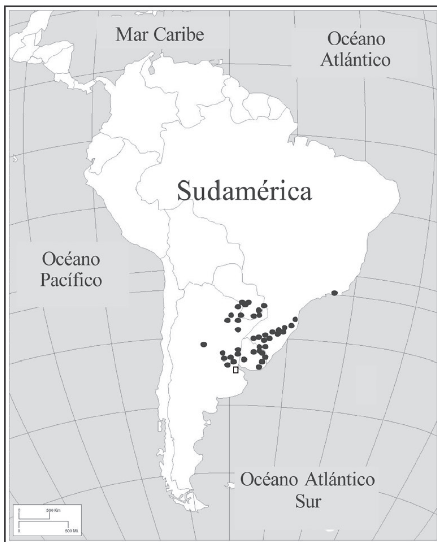
Figura 1. Distribución original de Phalloceros caudimaculatus . Los puntos negros son los lugares de ocurrencia de la especie tomados de López et al. (2003); Liotta (2006); Eschmeyer y Fricke (2008); Froese y Pauly (2008), y Lucinda (2008). El cuadrado blanco corresponde al Refugio Natural Educativo Ribera Norte.

Esta especie también puede encontrarse en Nueva Zelanda, Australia y Malawi (Froese y Pauly, 2008; Global Invasive Species Database, 2008), donde individuos de la misma fueron dispersados para control de mosquitos (McKay, 1984; Arthington y Lloyd, 1989; Arthington y McKenzie, 1997; Froese y Pauly, 2008) o bien llegaron al ambiente natural por fugas accidentales provenientes de acuarios, donde poseen un importante valor ornamental (Lintermans, 2004; Corfield et al. , 2008; Froese y Pauly, 2008). Phalloceros sp. posee las características de un exitoso grupo invasor, presentando gran plasticidad para adaptarse a distintas condiciones ambientales y una alta tasa reproductiva (Rowley et al. , 2005). El principal impacto de este género radica en el desplazamiento de peces nativos debido a competencia (Morgan et al. , 2004). Generalmente esta especie es confundida con Cnesterodon decemmaculatus Jenyns, 1842, debido a que posee una morfología externa semejante y a que forman cardúmenes conjuntos (Ringuelet, 1967; Laita and Aparicio, 2005).