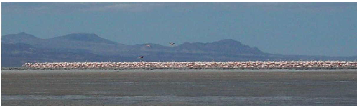
Foto 1. Colonia de cría de Flamenco Austral (Febrero 2010).

El hallazgo adquiere dimensión cuando advertimos que la especie es considerada por Chebez (2008) como el flamenco más raro y con escasos sitios de nidificación en el cono sur americano y que es incluida en el apén-