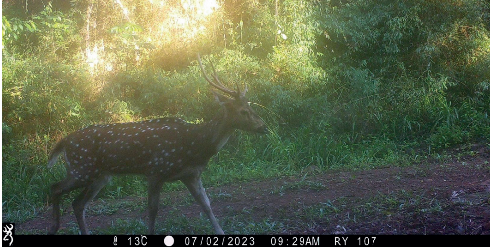
Foto 1. Una de las seis fotografías del ejemplar de ciervo axis registrado con una cámara trampa instalada en el Parque Provincial Salto Encantado del Valle del Cuñá Pirú.