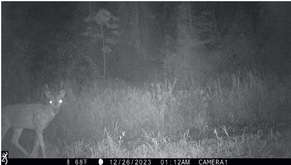
Foto 2. Segundo individuo de ciervo axis de presencia comprobada en el área protegida mediante esta única fotografía.