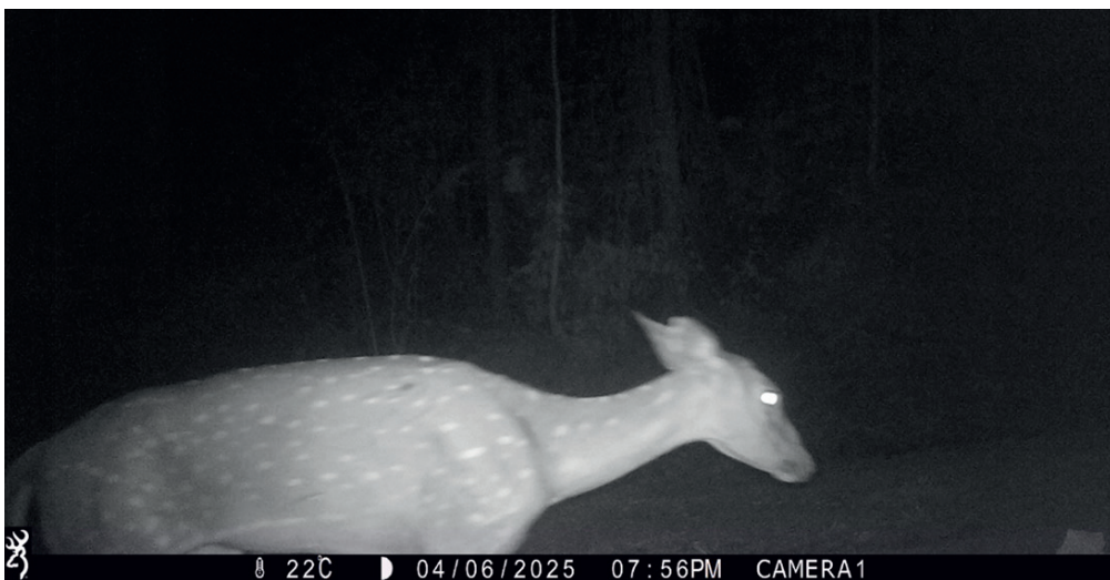
Foto 3. Tercera aparición de un Axis axis . No pudo determinarse su sexo al no conocer la época en que los machos voltean la cornamenta en la zona.