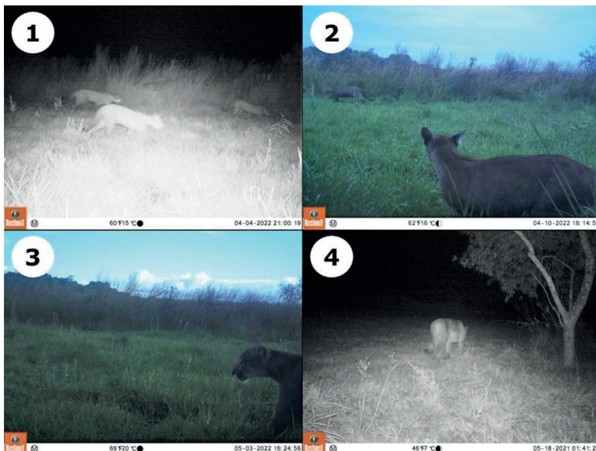
Fotos 1, 2, 3 y 4. Fotografías de Puma concolor ordenadas cronológicamente, tomadas por las cámaras-trampa instaladas en el estero Santa Lucía (1 a 3) y en el orillar (4) del Parque Nacional Mburucuyá (2021-2022). Aclaración: por un error de configuración de la cámara que tomó la foto (4), en la fecha figura el año 2021, pero corresponde al 2022.

Entre noviembre de 2021 y septiembre de 2022 se instalaron cámaras-trampa (Bushnell HD Low Glow) en cinco sitios del Parque Nacional Mburucuyá (PNM: 27.9986°, 58.0098°, Mapa). Dos de las cámaras se ubicaron en sitios linderos al estero Santa Lucía (ambientes “estero” y “orillar”) y las otras tres en palmares de Butia yatay , inmersos en una matriz de espartillar de Elionurus muticus , en un pastizal de paja colorada Andropogon lateralis , y el tercero en zonas adyacentes a un sendero turístico (clasificación de ambientes según el Plan de Gestión 2019-2029 del PNM). Las cámaras ubicadas en el palmar con paja colorada, en el estero y en el orillar se instalaron orientadas hacia cortafuegos, mientras que las restantes se ubicaron dentro de la vegetación. Las cámaras tomaron dos fotografías por cada movimiento detectado por el sensor, con un