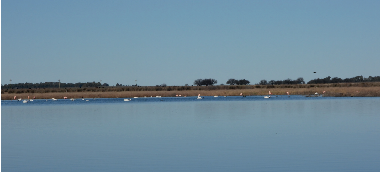
Foto 2. Ambiente donde se encontraban las parinas, compartido con otras especies acuáticas típicas de la zona.

BIRDLIFE INTERNATIONAL. 2023. Ficha de especies: Phoenicoparrus andinus . Descargado de http://datazone.birdlife.org/species/factsheet/andean-flamingo-phoenicoparrus-andinus el 02/09/2023. CHIALE, M. C., L. G. PAGANO y C. I. ROESLER.