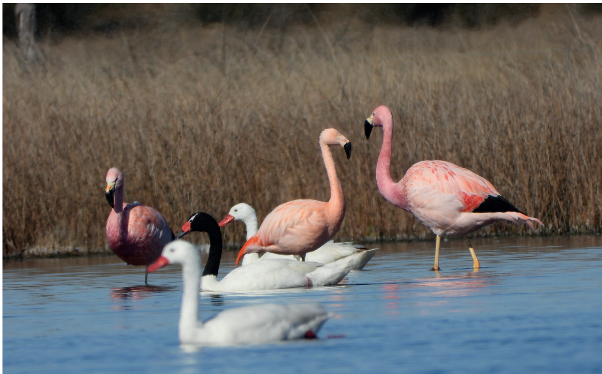
Foto 1. Imagen donde se aprecian los dos individuos de parinas grandes, junto con un ejemplar de flamenco austral, cisne cuello negro y dos coscorobas.