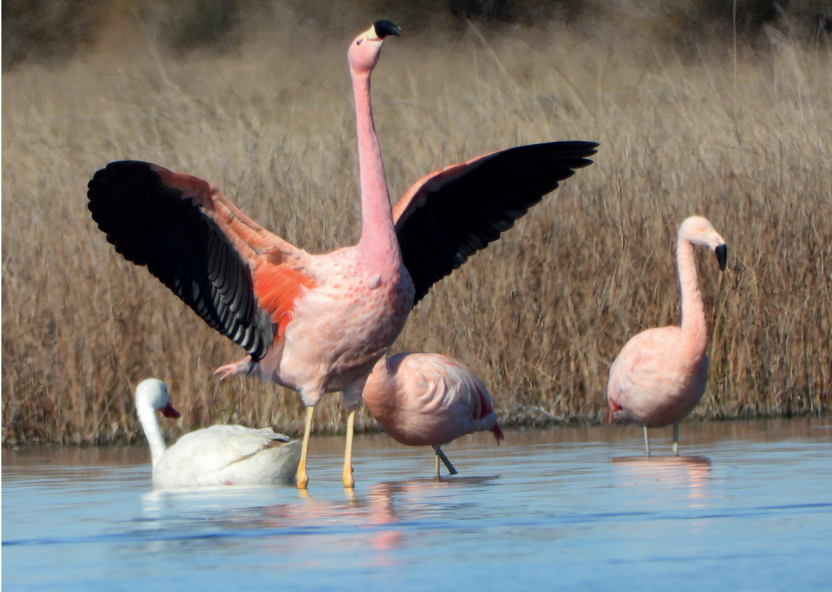
Foto 3. Imagen de un individuo elongando sus alas, donde puede notarse su tamaño algo mayor, además de su coloración general y sus patas amarillas.