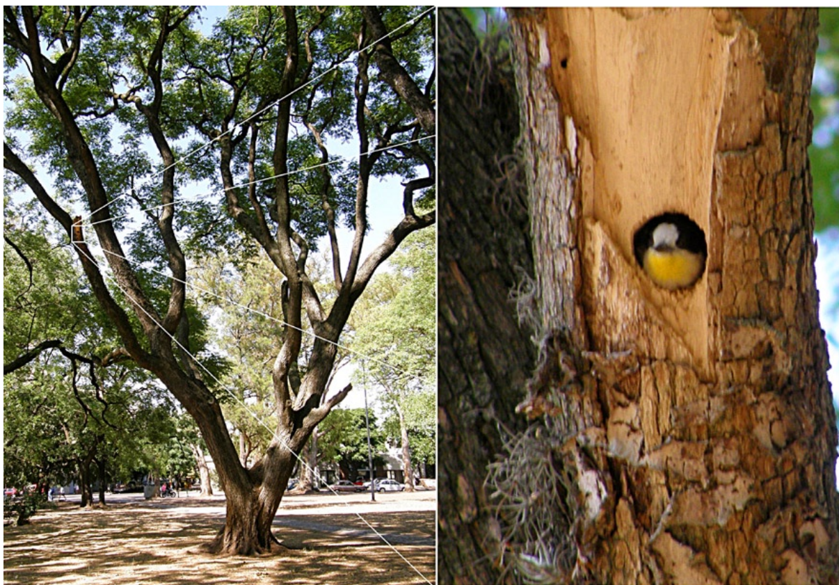
Hembra de Melanerpes cactorum en su nido.