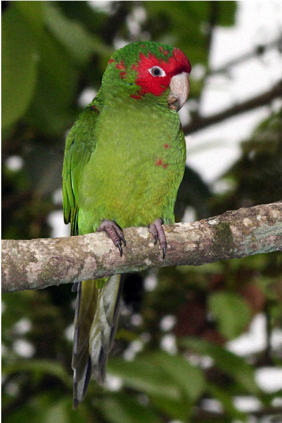
Un ejemplar de Aratinga mitrata .

Departamento de Santa Cruz de la Sierra; CML 15413, 15414, 15417), donde solo se encontraría A. m. mitrata , son coincidentes en un todo con el morfotipo A. m. tucumana . Finalmente, son comúnmente observados especímenes con caracteres intermedios entre ambas subespecies (e.g. CML 14642, 15411) los cuales exhiben la banda loreal y las mejillas con una proporción de rojo intermedia entre ambos morfotipos. En consecuencia, la distribución geográfica irregular de los morfos A. m. mitrata y A. m. tucumana , la presencia de ambas “subespecies” en una misma localidad (Valle Grande, Jujuy)