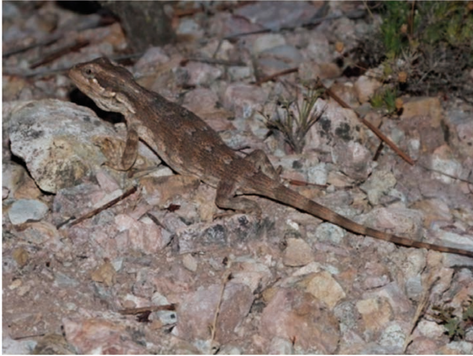
Foto 1. Ejemplar de Leiosaurus catamarcensis registrado durante enero de 2018 en la Reserva Natural Divisadero Largo.