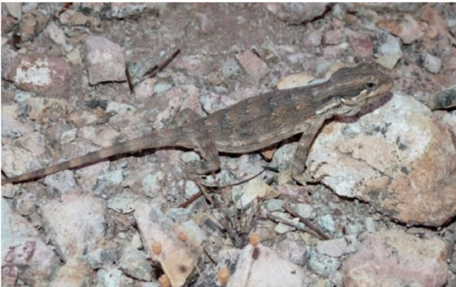
Foto 2. Leiosaurus catamarcensis es un reptil difícil de observar debido a su coloración que lo confunde con el entorno.

con más observaciones para obtener datos sobre su comportamiento y ecología, actualmente escasos.