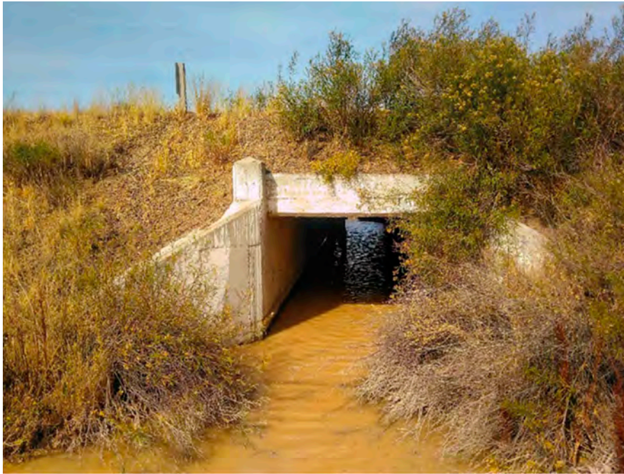
Foto 2. Alcantarilla donde fue hallado el nido en la provincia del Chubut.

bientes con aguas temporarias o no permanentes, denominados localmente como lagunas secas.