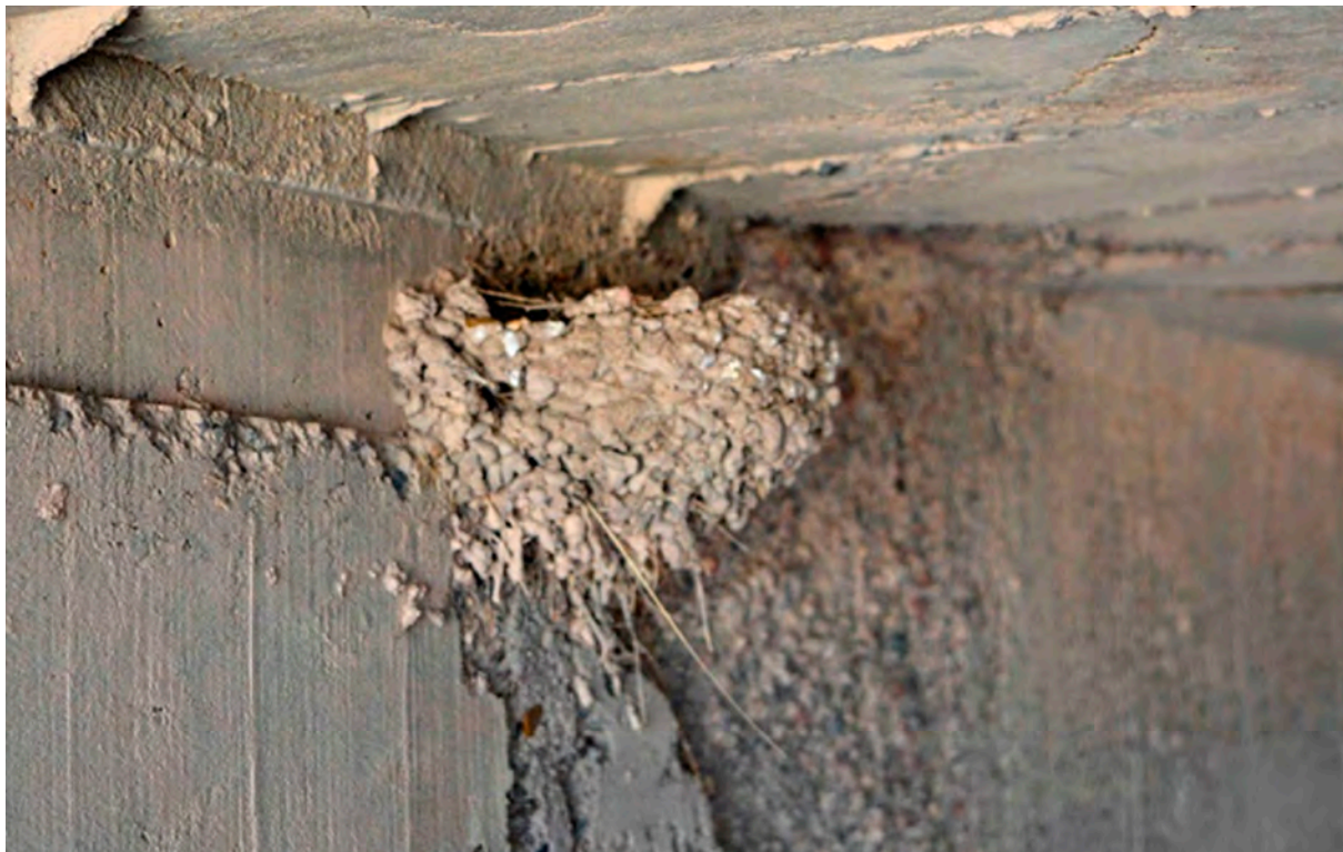
Foto 1. Nido de Hirundo rustica erythrogaster hallado en la provincia del Chubut.

El resto de los nidos también estuvo ubicado en am-