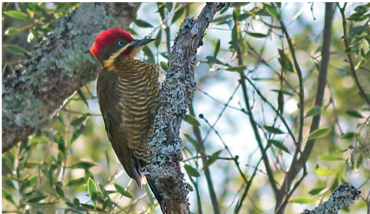
Foto 1. El Carpintero Dorado Común ( Piculus chrysochloros ) presenta pico negro, patas grises, dorso oliva y garganta amarilla. La zona ventral presenta barrado de amarillo y oliva. La corona es roja en el macho. Además, se observa línea malar amarilla y cara oliva. El malar rojo en el macho.