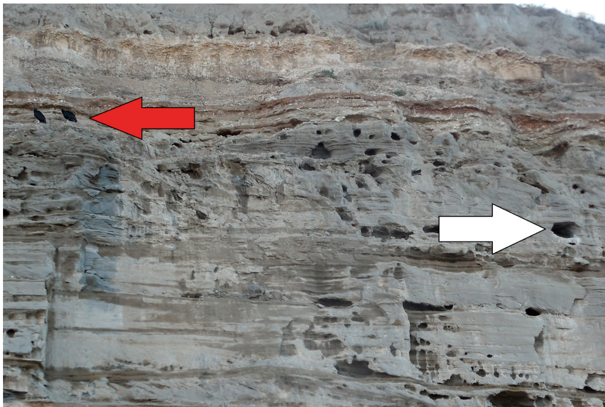
Foto 2. Pareja de Coragyps atratus (flecha roja) y nido (flecha blanca) a principios de octubre de 2015.