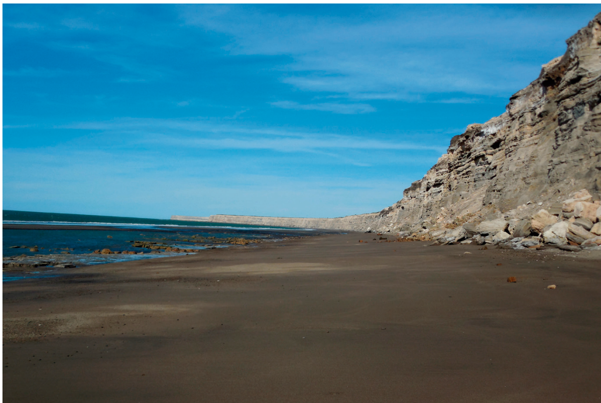
Foto 5. Acantilados en el territorio de nidificación de Coragyps atratus . Parte de la proyectada Área Natural Protegida “Estuario de Río Negro, Colonia de Loros Barranqueros y zonas de influencia”.

tunamente mencionada), en la Villa Balnearia de El Cóndor, unos 14-16 km hacia el oeste (Foto 4), obtuvo un dictamen favorable de la Comisión de Planificación, Asuntos Económicos y Turismo de la provincia. Es de esperar que finalmente se concrete su creación, lo que garantizará la conservación de esta área de gran importancia para nuestro patrimonio natural.