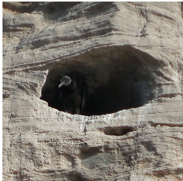
Foto 1. Noviembre de 2014. Se observó un ejemplar de Coragyps atratus en una oquedad en acantilados del litoral rionegrino que luego sería confirmada como nido activo, en 2015.

ción de la misma cavidad de 2014 (Foto 2). Finalmente, durante un relevamiento de este territorio, realizado el 15 de noviembre de 2015, se observó, mediante el empleo de binoculares 8 x 40, a un adulto y dos pichones dentro de la oquedad, confirmando así la nidificación (Foto 3). Los pollos tenían ya el tamaño adulto y estaban cubiertos por un plumón de color beige.