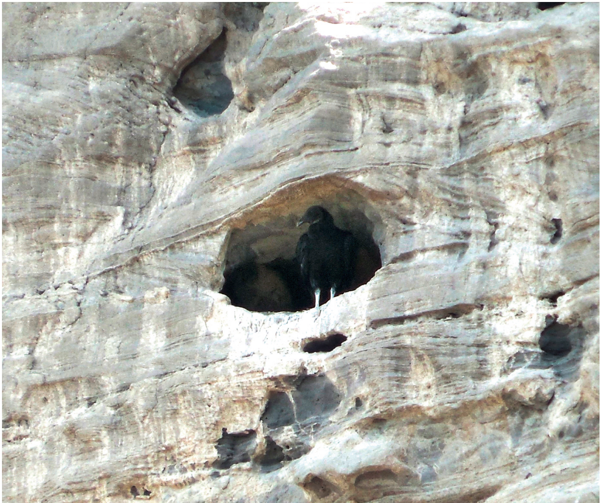
Foto 3. Nido de Coragyps atratus en una cavidad excavada por Cyanoliseus patagonus el 15 de noviembre. Nótese la presencia de dos pichones de plumón claro y cabeza oscura, detrás del ejemplar adulto.

Los nidos de loros barranqueros, de la colonia ubicada en el departamento de Adolfo Alsina, en proximidades de la villa balnearia de El Cóndor (la más grande concentración de parejas de un psitácido en el mundo- unos 35.000 nidos- Masello y Quillfeldt, 2005, 2006,