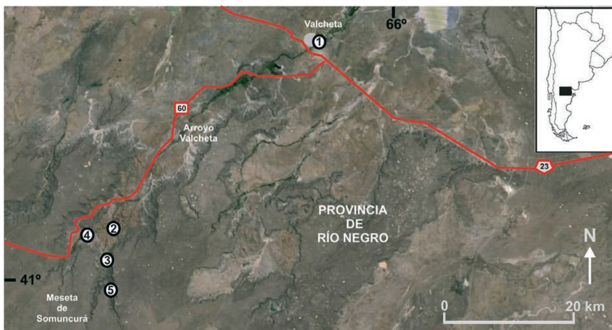
Mapa. Ubicación del arroyo Valcheta, provincia de Río Negro, Argentina. Círculos blancos: indican los sitios de muestreo. Círculo gris: localidad de Valcheta.

Durante enero y febrero de 2013 y 2014 se realizaron muestreos en cinco lugares diferentes del arroyo Valcheta. En el transcurso de estos muestreos se encontró un nuevo registro de la mojarra Cheirodon interruptus , el cual constituye el motivo de la presente nota. Este arroyo se encuentra ubicado en el sureste de la provincia de Río Negro (entre 40°34'34"S,