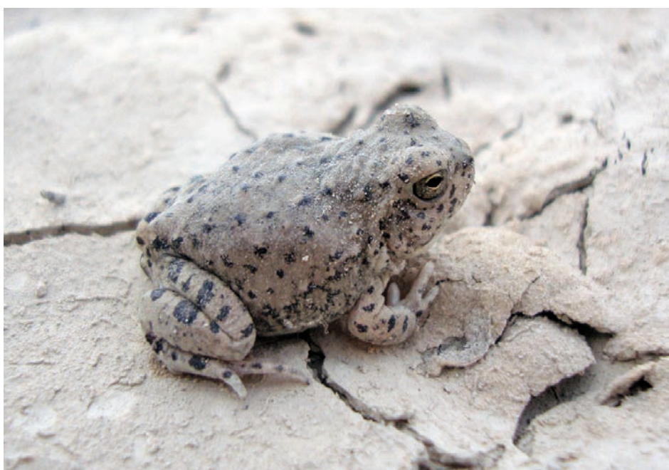
Foto. Pleurodema nebulosum , Salitral Moreno, 28 km S General Roca, Dpto. El Cuy, Provincia de Río Negro. Foto: Pablo Chafrat.

Aquí son aportados nuevos registros donde se confirma que la distribución de ésta especie supera el cauce del río Negro (72 km al suroeste de la localidad de Villa Regina) en la región centro-oeste de la provincia (Mapa).