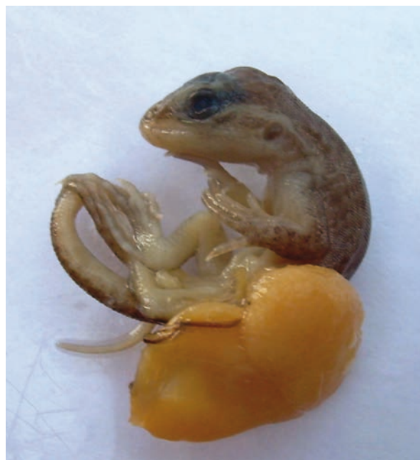
Foto 4. Se observa embrión fuera de la membrana vitelina junto al vitelo.