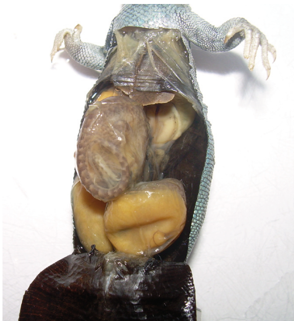
Foto 3. Se observa posición del embrión en estadio de desarrollo avanzado.