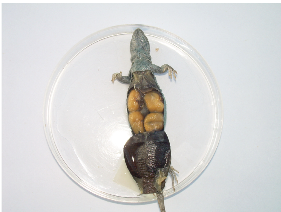
Foto 1. Hembra preñada, puede observarse el vitelo de los cuatro embriones.

Liolaemus ruibali presenta tamaños de camada similares a otras especies de Liolaemus vivíparos de la Argentina y Chile (Ibargüengoytia et al. , 2002; Vidal Maldonado y Labra Lillo, 2008).