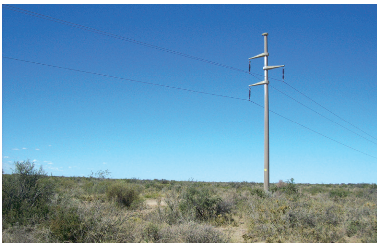
Foto 2. El poste de hormigón armado centrifugado, empleado como sitio de nidificación, en una línea de transmisión eléctrica.

Luego de detener el vehículo y de efectuar un acercamiento para observar a este ejemplar y a su posadero, se pudo distinguir la presencia de un nido, apenas visible, prácticamente oculto en una cavidad presente en una de las crucetas (“brazos”) que caracterizan a este tipo de poste (Foto 3). Al poco tiempo, un macho (diferencia-