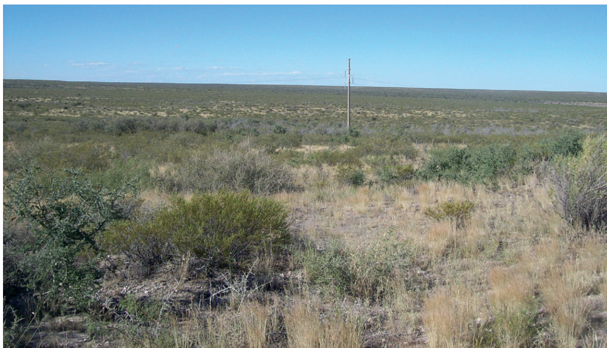
Foto 1. Características del hábitat de una pareja nidificante de Falco femoralis en el noreste patagónico.

En el presente trabajo se proporciona un registro de una pareja nidificando en un poste de electricidad, un sitio de nidificación aún no descrito para la subespecie F. femoralis femoralis (ni pichincha ) de este halcón.