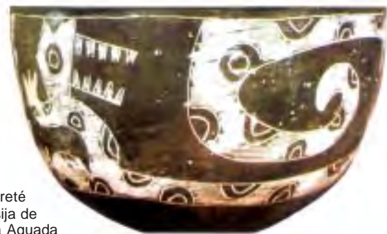
Yaguareté en vasija de cultura Aguada

Longevidad: hasta 20 años en cautiverio y se estima unos 12 años en libertad.