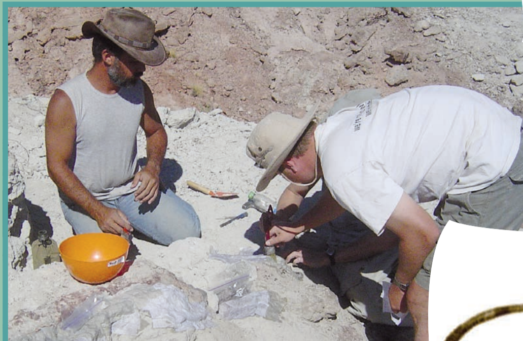
Paleontólogos descubriendo un nuevo dinosaurio carnívoro en la Patagonia.

El paleontólogo José F. Bonaparte, el gran impulsor de los descubrimientos de dinosaurios en nuestro país.