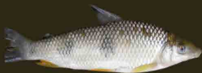
Boga Leporinus obtusidens