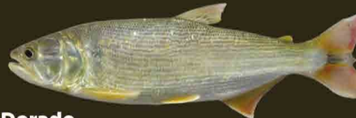
Dorado Salminus brasiliensis