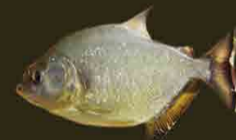
Piraña o palometa Serrasalmus maculatus