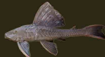
Vieja del agua Hypostomus commersoni