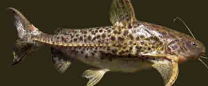
Armado común Pterodoras granulosus