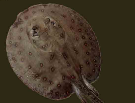
Raya de río Potamotrygon motoro