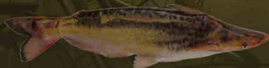
Manduví Ageneiosus militaris