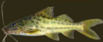
Bagre amarillo Pimelodus maculatus