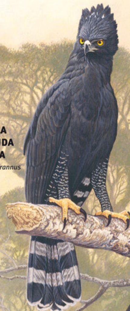
ÁGUILA CRESTUDA NEGRA Spizaetus tyrannus