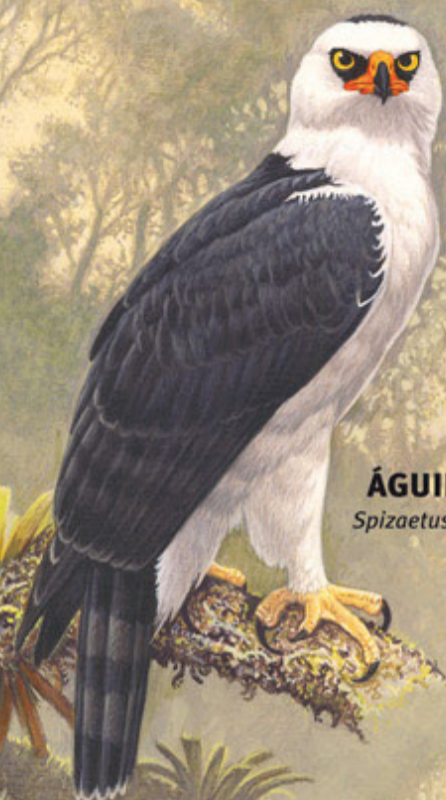
ÁGUILA VIUDA Spizaetus melanoleucus