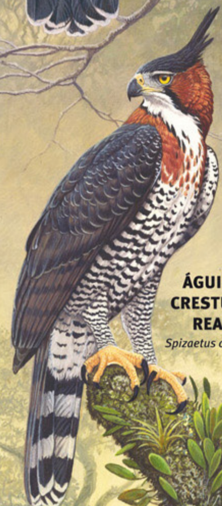
ÁGUILA CRESTUDA REAL Spizaetus ornatus