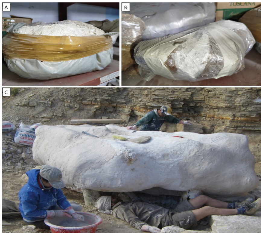
A: bochón de yeso y stretch film; B: bochón de stretch film; C: bochón de yeso.