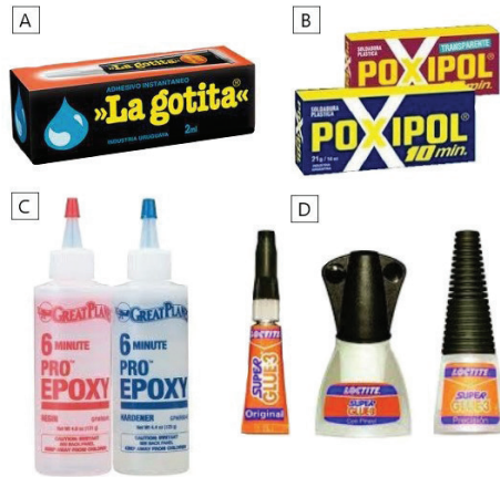
A: cianoacrilato líquido; B: pegamento dos componentes; C: epoxi; D: cianoacrilato medio y denso.

- Epoxi de dos componentes (como Poxipol®): Muy resistente, apto para uniones estructurales o con escaso contacto superficial.