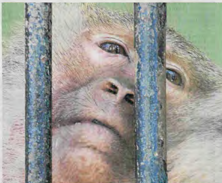
En La Plata, la tristeza es una constante entre los animales enjaulados

Ayer, LA NACION consultó a varios zoológicos sobre este relevamiento, pero no obtuvo respuesta. El oceanario Mundo Marino, en San Clemente del Tuyú, confirmó que recibió el informe y lo está analizando. ●