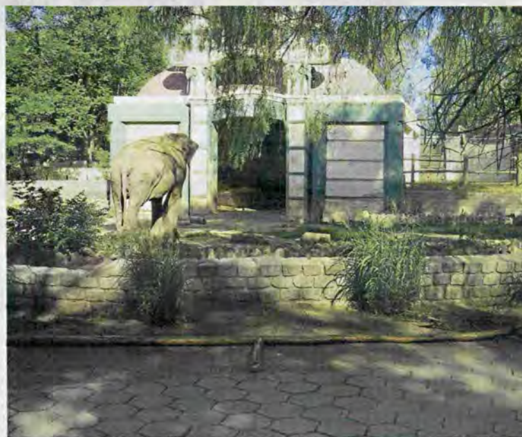
Deterioro de la infraestructura en un zoológico de Córdoba