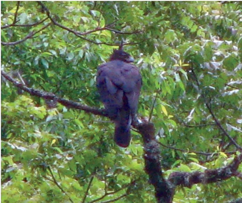
Serie 1. Adulto de Spizaetus isidori posada en un Juglans australis en el Parque Provincial Potrero de Yala.

San Francisco: Departamento Valle Grande, provincia de Jujuy. Contaba con observaciones desde 1956-1957, (Olrog, 1956; Chebez et al. , 1998). Este nuevo registro confirma la permanencia de la especie en el lugar. El 16 de diciembre de 2009 se observó un juvenil volando rasante sobre las copas del dosel del bosque montano, aprovechando seguramente las corrientes laminares, sobre el cauce del río Valle Grande. A las 11 hs, el día era despejado y templado. Es sorprendente la aptitud de vuelo de esta rapaz ya que se sumergía prácticamente sobre el dosel para retomar nuevamente como lo suele hacer el Jote Cabeza Colorada ( Cathartes aura ), con la diferencia que generalmente el Cathartes lo hace con las alas extendidas mientras el Spizaetus isidori plegaba