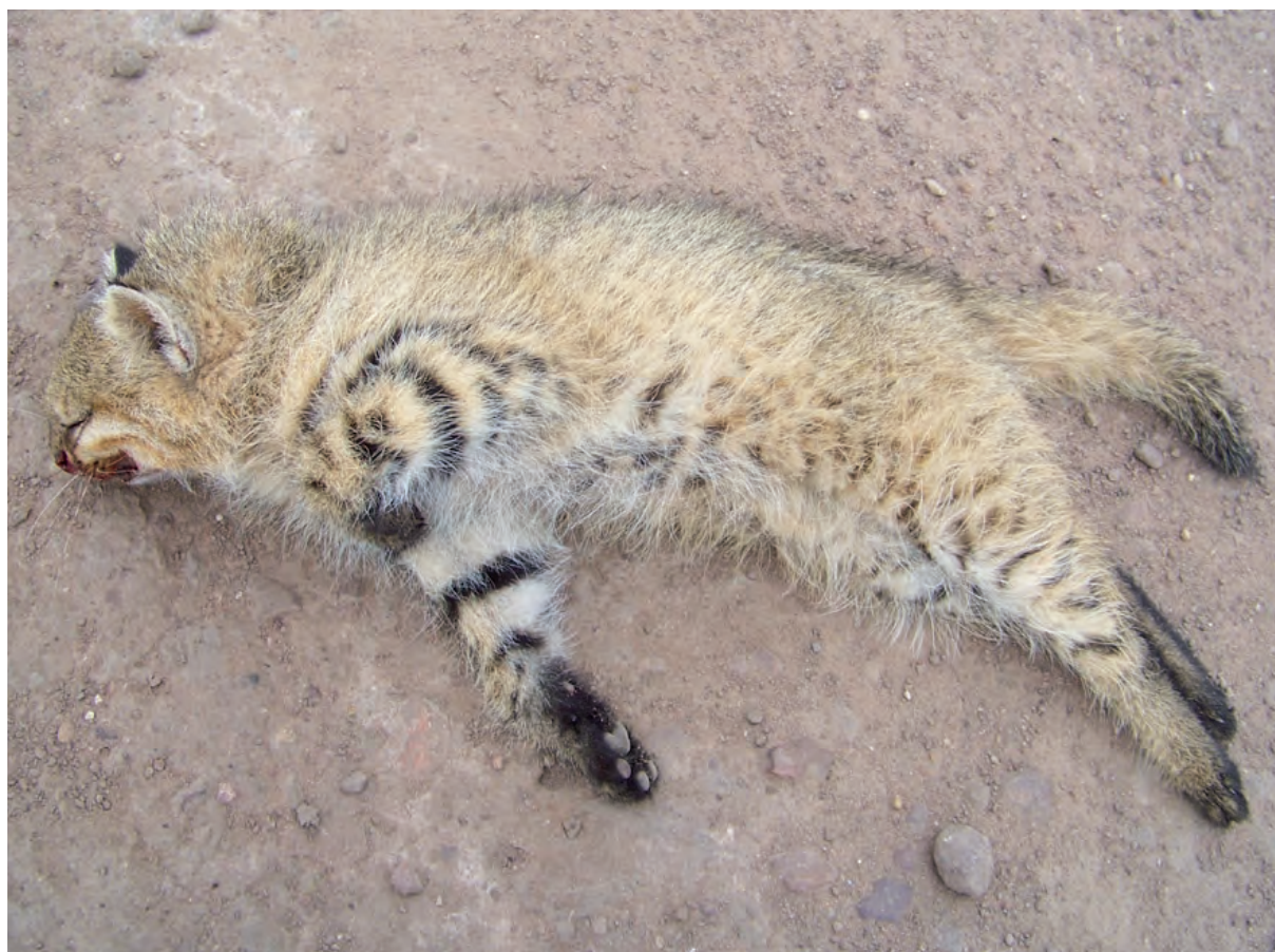
Figura 1. La hembra atropellada que motiva la presente comunicación. Nótese la planta del pie delantero derecho bien oscura casi negra; color que se extiende en las patas delanteras hasta las muñecas por la parte posterior y en igual forma hasta el tarso en las traseras.

pata delantera derecha, que es blanca y tiene dos bandas transversales oscuras bien notorias. La parte anterior de las extremidades es grisácea: en los antebrazos delanteros presenta manchas bien oscuras que tienden a formar fajas notables, mientras que en las traseras las manchas forman líneas angostas. Puede observarse que la planta del pie delantero derecho es oscura casi negra; ese color se extiende en las patas delanteras hasta las muñecas (carpo) por la parte posterior y en igual forma hasta el tarso en las traseras. El ejemplar concuerda bien con la descripción de la subespecie Lynchailurus braccatus munoai (Ximénez, 1961) sobre todo por su diseño con fajas y la característica coloración de las patas. También es coincidente con la ilustración diagnóstica de García-Perea (1994) excepto por el barrado en la porción distal de la cola que no se observa así en este individuo si bien su extremo se nota bien oscuro. La validez del género Lynchailurus así como un análisis pormenorizado de la distribución geográfica de la especie ya fue discutido por dos de los autores (J. C. C. y N. A. N.) en un trabajo anterior (Chebez et al. , 2008) por lo que, remitimos al mismo a quien quiera profundizar sobre el tema. Curiosamente se lo ha citado recientemente para la provincia como " Leopardus colocolo [Lynchailurus pajeros] " (Soler y Cáceres, 2009) sin referencias ni fundamenta-