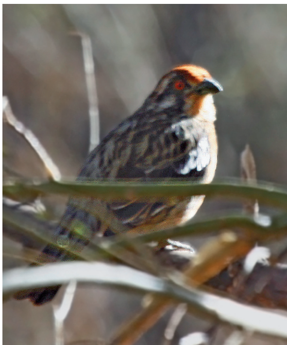
Foto 1. Ejemplar macho adulto de Phytotoma rara se diferencia de la hembra, por la coloración rufa intensa de la frente y corona, al igual que en el pecho, pero debido a la posición captada en la secuencia, es poco visible. Observado el 28 de agosto de 2010 en el Parque Nacional El Leoncito, provincia de San Juan.